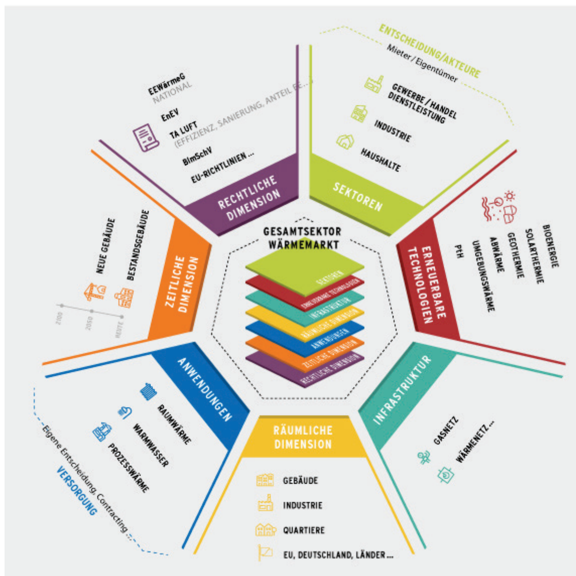
Abbildung 2 Vielfalt des Wärmemarktes – Dimensionen des Wärmesektors

Die Wärmewende kann nicht allein durch den Ausbau der Wärmebereitstellung aus Biomasse gelingen. Nur im Zusammenspiel von Wärmebedarfsersparungen und allen verfügbaren nachhaltigen Wärmequellen kann die Umstellung auf eine weitgehend klimaneutrale Wärmeversorgung erfolgen. Auch wenn die Einzeltechnologien verfügbar sind, so ist ihr effizientes und effektives Zusammenspiel oft nicht abschließend in allen notwendigen Größenbereichen und Kombinationen erprobt und demonstriert. Hinzu kommen wesentliche Herausforderungen bei der Installierbarkeit und der Bedienbarkeit, die sowohl entsprechende Forschung als auch die Schulung und Information des Handwerks sowie entsprechender Dienstleister (Planer, Contractoren, Anlagengerichter) erfordert. Entscheidend in dem vielfältigen Akteursumfeld im Wärmesektor sind planbare und verlässliche Vorgaben der Politik. Die in diesem Zusammenhang bekannten Ansätze (Investitionsförderung, CO 2 -Abgaben, Technologieverbote etc.) betreffen nicht nur die Bioenergie und sollen daher nicht weiter ausgeführt werden. Vielmehr sollen spezifische Bioenergieaspekte diskutiert werden (siehe Abbildung 2).