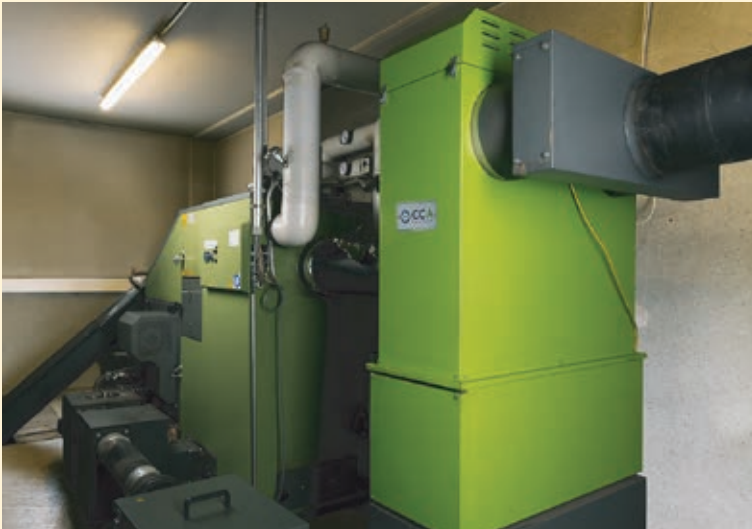
Abb. 3 Ein 100-kW-Feinstaubfilter im Feldtest

Dank moderner Feuerungstechnik haben die Hersteller von Biomasse Feuerungsanlagen in der Vergangenheit die Partikel-Emissionen deutlich gesenkt. Um den Grenzwert der 2. Stufe der 1. BImSchV dauerhaft einhalten zu können, reichen aber diese primärseitigen Optimierungen nicht aus. Sekundäre Maßnahmen sind erforderlich. Deshalb wächst in Deutschland der Markt für Abscheidesysteme. Für den Leistungsbereich der 1. BImSchV zwischen 4 und 1.000 kW wird ein Marktvolumen von ca. 40.000 Kesselanlagen pro Jahr erwartet, die zum Teil mit Abscheidern auszustatten sind. Exportmöglichkeiten innerhalb Europas sehen die Forscher insbesondere für Italien und Österreich, da dort relevante Hersteller von Heizkesseln angesiedelt sind.