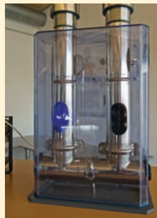
Abb. 4 Links: Prototypen des Abscheiders im Testbetrieb Rechts oben: Coronaentladung an der Hochspannungselektrode Rechts unten: Abscheider im Modell mit Ionisator und Bürste des Kollektors

tiven Anpassungen vor allem kosteneffizient mit dem Kessel zu verbinden. Die optimale Bauweise wurde anhand mehrerer Prototypen von verschiedenen Kessel-Abscheider-Kombinationen identifiziert.